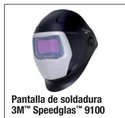
Pantalla de soldadura 3M™ Speedglas™ 9100

3M ofrece una completa gama de accesorios que hacen más sencillo adaptar los sistemas de protección a las necesidades individuales de cada usuario. Cuando se usan los equipos motorizados, los usuarios deben también elegir los filtros de protección adecuados a los contaminantes existentes. Para los equipos de suministro de aire, 3M ofrece una opción para las unidades de aporte de aire filtrado y sus conexiones. Para más detalles, consulte los productos en nuestro Catálogo de Protección para la soldadura.