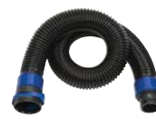
Tubo resistente de caucho

Tubos de respiración con conexión QRS para los equipos de suministro de aire