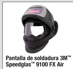
Pantalla de soldadura 3M™ Speedglas™ 9100 FX Air

Filtros de soldadura serie 3M™ Speedglas™ 9100