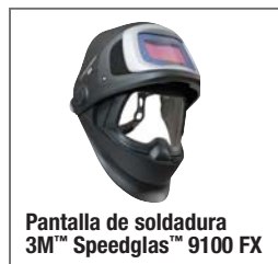
Pantalla de soldadura 3M™ Speedglas™ 9100 FX