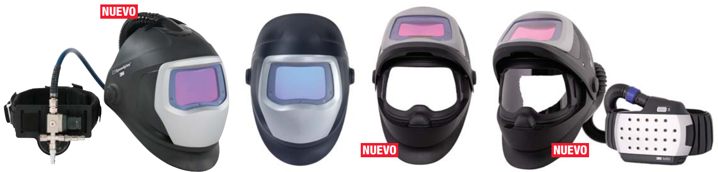
3M™ Speedglas™ 9100 Air

3M presenta tres nuevas pantallas de soldadura 3M™ Speedglas™ que ofrecen al mismo tiempo un filtro de soldadura abatible y protección respiratoria. Cada modelo tiene todas las características de las pantallas de soldadura de la serie 3M Speedglas 9100.