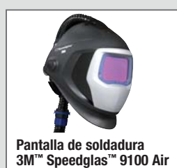
Pantalla de soldadura 3M™ Speedglas™ 9100 Air