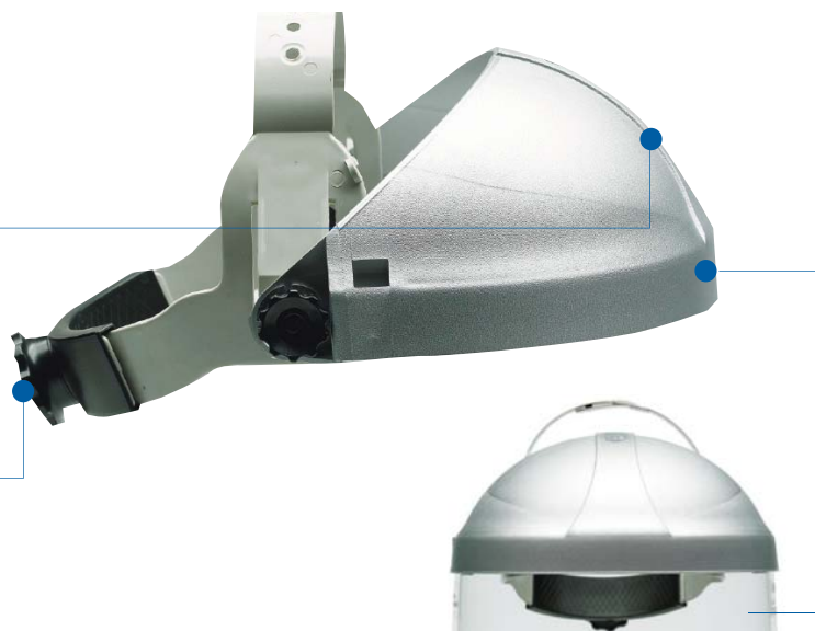
Sistema de recambio Easy Change™.