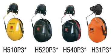
H510P3* H520P3* H540P3* H31P3*